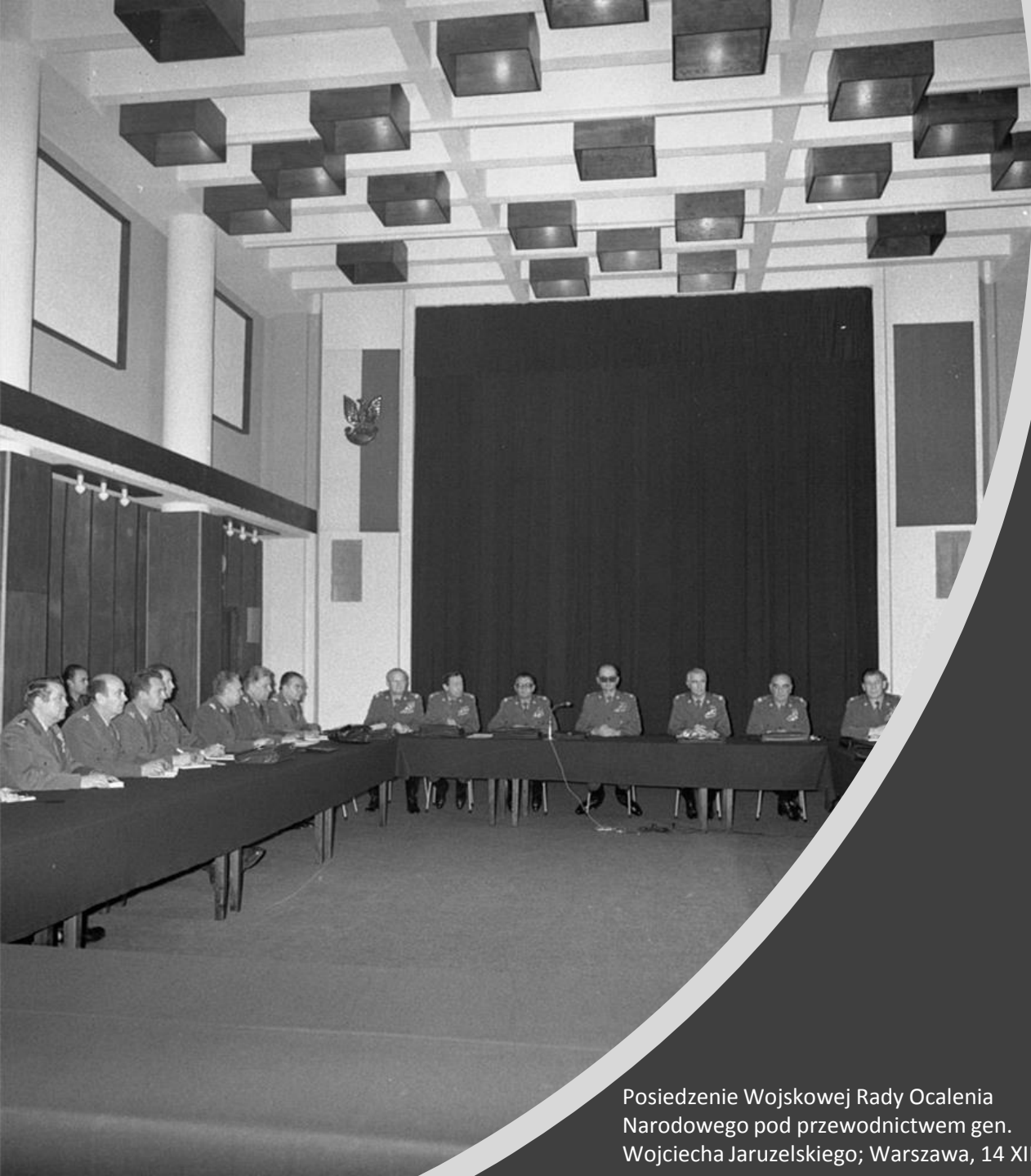
Posiedzenie Wojskowej Rady Ocalenia Narodowego pod przewodnictwem gen. Wojciecha Jaruzelskiego; Warszawa, 14 XII 1981