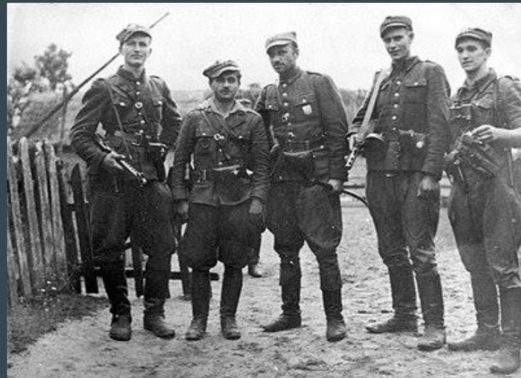
Żołnierze 5 Wileńskiej Brygady AK.

„Żołnierze Wyklęci” to uczestnicy polskiego zbrojnego podziemia niepodległościowego, którzy brali udział w wojnie obronnej w 1939 r., a następnie działali w formacjach, które później zostały scalone w ramach AK lub w innych organizacjach. Żołnierze kontynuowali walkę po rozpoczęciu tzw. drugiej okupacji sowieckiej. Liczbę członków wszystkich organizacji i grup konspiracyjnych szacuje się na 120–180 tysięcy osób.