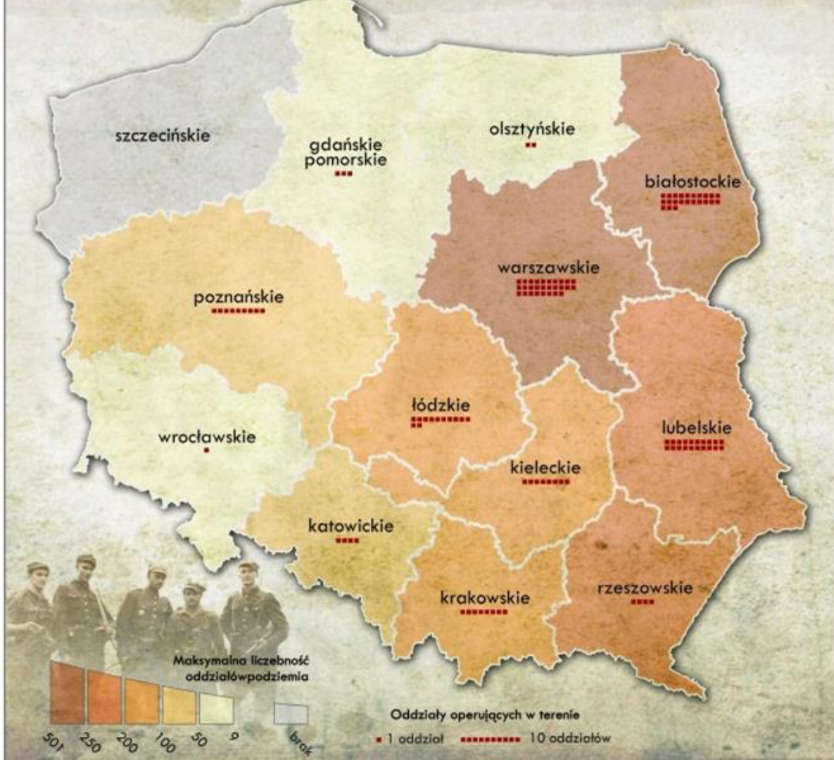
Maksymalna liczebność podziemia w latach 1947-1950