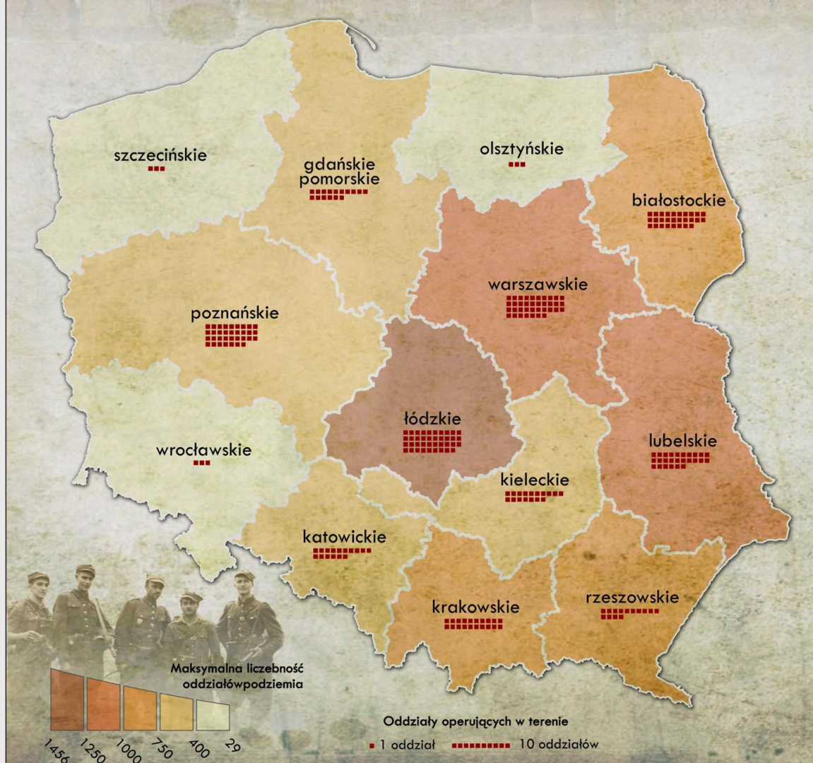
Maksymalna liczebność podziemia w latach 1946-1947