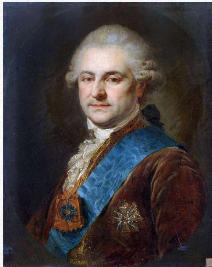
król Stanisław August Poniatowski